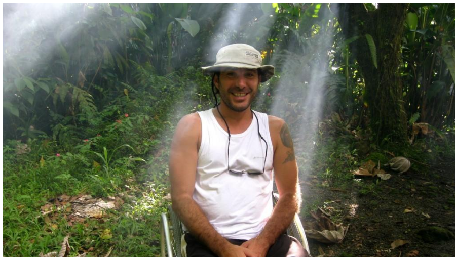
Randonnée et handicap en forêt tropicale en Guadeloupe

C'est un moment d'émotion de constater le courage de ces amis et le plaisir qu'il nous montrent par leurs cris, leurs sourires, leurs quolibets dans l'eau froide du BASSIN BLEU!