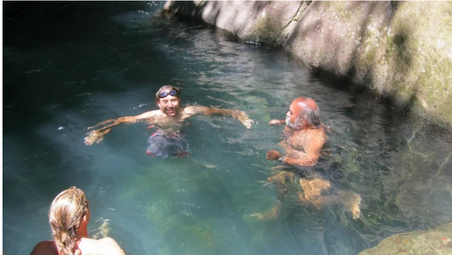
bassin bleu gourbeyre guadeloupe

C'est un moment d'émotion de constater le courage de ces amis et le plaisir qu'il nous montrent par leurs cris, leurs sourires, leurs quolibets dans l'eau froide du BASSIN BLEU!